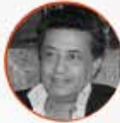
صلاح الوديع شاعر وفاعل دولي